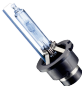
PREMIUM - homologacja EU, filtr UV